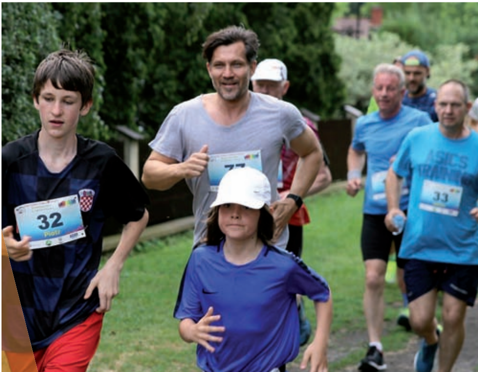
16 czerwca 2019 r. "Biała sobota" podczas festynu rodzinnego na osiedlu Ogrody, który został zrealizowany w ramach Budżetu Obywatelskiego oraz bieg połączony ze zbiórką funduszy na budowę domu dla obłożnie chorych