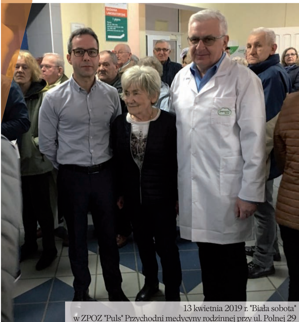
13 kwietnia 2019 r. "Biała sobota" w ZPOZ "Puls" Przychodni medycyny rodzinnej przy ul. Polnej 29