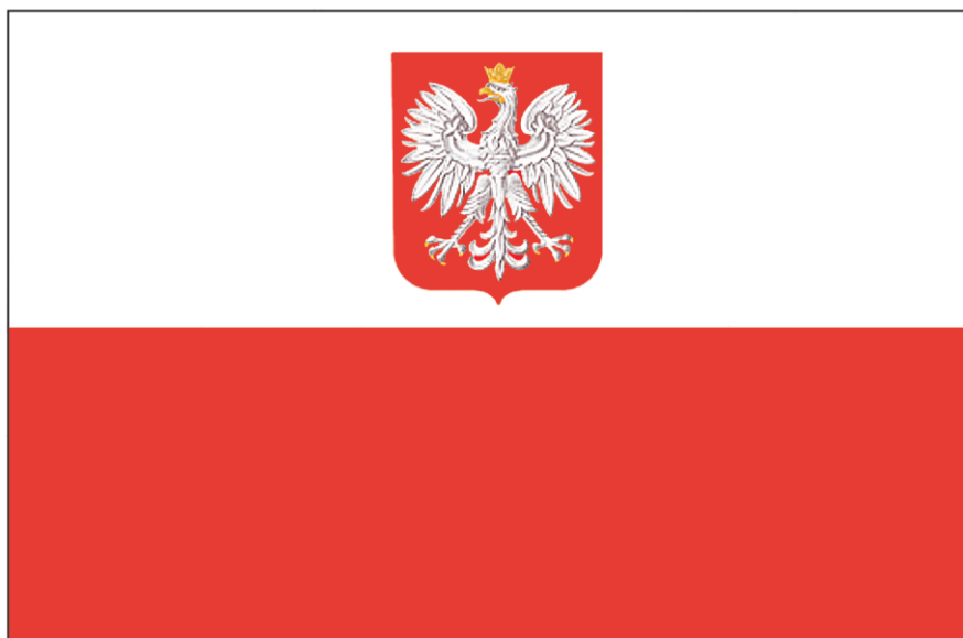
Flaga państwowa z godłem Rzeczypospolitej Polskiej

Stosunek wysokości godła do szerokości flagi – wynosi 2:5